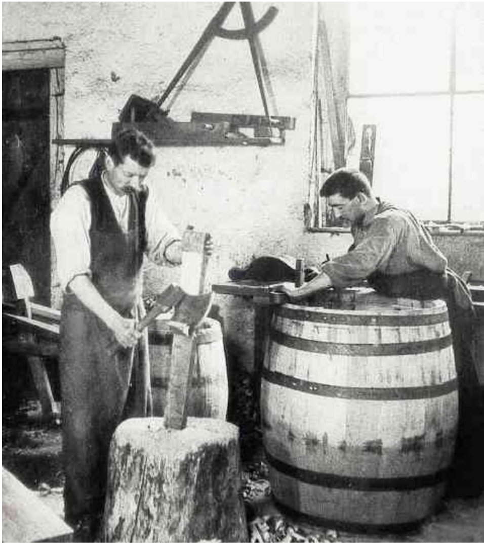
Durant les premières années de son existence, l'usam défend prioritairement les intérêts de l'artisanat traditionnel, comme ceux des tonneliers.

Les premiers statuts de l'Union suisse des arts et métiers usam* prévoyaient déjà la création d'un bureau permanent occupé par un secrétaire salarié, du moins «dès que les moyens financiers le permettraient». D'après le juriste bernois Hans Tschumi, conseiller national, président de l'usam entre 1915 et 1930 et premier rédacteur de la Schweizerische Gewerbezeitung , omettre la création d'un secrétariat permanent au moment de la fondation de l'Union fut une erreur et un manque de dévouement, écrit-il dans son ouvrage paru en 1929 à l'occasion du 50 e anniversaire de l'usam. Il est difficile de déterminer aujourd'hui si cela constitua réellement une erreur ou non. Une chose est sûre cependant : l'encadrement de l'organisation, qui prenait la forme d'un Vorort se réunissant et changeant tous les deux ans, ne suffisait plus. L'administration était en outre gérée par chaque section correspondante, chargée en même temps de nommer les présidents. Entre 1880 et 1910, le nombre de sections affiliées passe de 36 à 175 et le nombre de membres d'associations d'arts et métiers indépendantes et organisées de 1750 à 50 000.