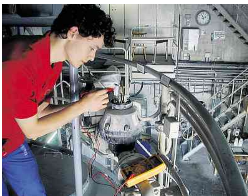
L'économie suisse a un besoin urgent de main-d'œuvre qualifiée dans le secteur technique comme la mécatronique (photo). Pour ce faire, des mesures incitatives s'imposent !