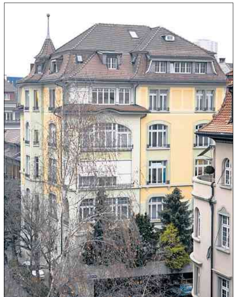
Depuis 1942, le secrétariat de l'usam à la Schwarztorstrasse à Berne constitue le centre névralgique de l'organisation.

*En allemand, le terme d'union ( Gewerbeverband ) ne date cependant que de 1916 lors d'une révision des statuts ; jusque-là, il avait toujours été question de Gewerbeverein .