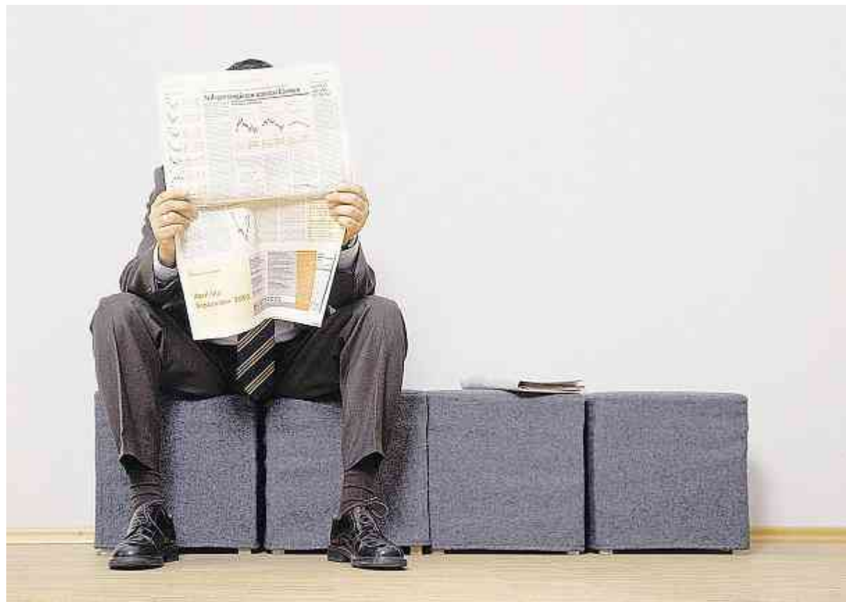
En tant que chômeur, il y a plus de risques qu'en cas d'accident, les coûts soient plus élevés.

La réintégration professionnelle des chômeurs victimes d'accidents peut être accélérée en prenant des mesures appropriées. C'est pourquoi la Suva intensifie ses efforts de réinsertion, qui sont étroitement coordonnés avec le SECO et les offices régionaux