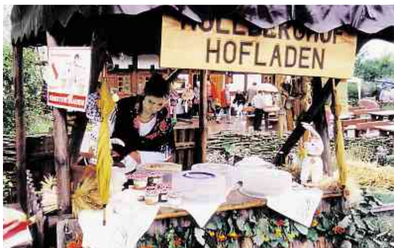
Le risque qu'il y est distorsion de la concurrence existe à partir du moment où les agriculteurs pratiquent des activités propres aux arts et métiers.

La frontière entre les arts et métiers et l'agriculture est parfois sujette à des