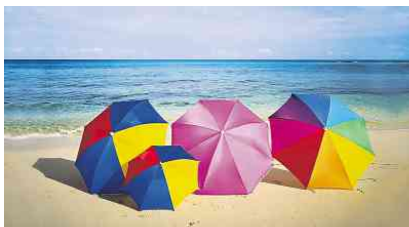
Nombreuses sont les conventions collectives de travail qui prescrivent déjà cinq ou six semaines de vacances pour les collaborateurs de longue date ou les collaborateurs d'un certain âge.

L'usam a par conséquent clairement rejeté l'initiative sur les vacances de Travail.Suisse. Cette initiative est inutile et lance un mauvais signal concernant l'augmentation des coûts