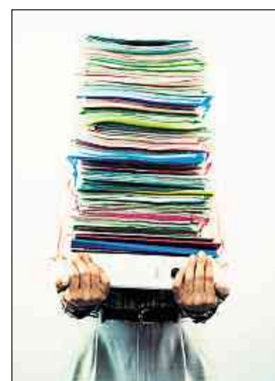
La bureaucratie doit être à tout prix combattue, car elle constitue une entrave aux investissements, à l'esprit d'initiative et à l'innovation.