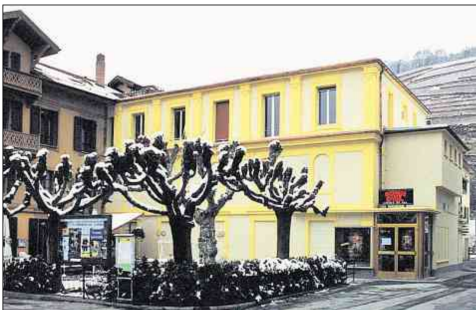
Le film à l'affiche change chaque semaine au cinéma Grain d'Sel. Une sélection de documentaires et de films d'auteur complète, une semaine sur deux, le programme «grand public».

Le nombre d'écrans est en hausse en Suisse: depuis l'an 2000, la notre pays compte une soixantaine d'écrans supplémentaires, pour un total de 562 à l'été 2010. Une augmentation qui n'empêche pas le nombre de cinémas de diminuer. Entre 2000 et 2009, 42 salles ont disparu du paysage cinématographique suisse. Ce phénomène est intimement lié à l'arrivée des multiplex. Le nombre de spectateurs reste quant à lui stable, se situant entre 15 et 17 millions par an. La conversion des salles au numérique implique des coûts importants que les petites salles ne sont pas en mesure de couvrir seules. Il est toutefois impossible de prédire combien de salles fermeront. Pro Cinema, l'association des exploitants et distributeurs de films, estime qu'environ 30% des écrans ne rapportent que 100 000 francs par an et ne pourront pas financer cette dépense. L'Office fédéral de la culture (OFC) est légèrement plus optimiste: elle table sur la fermeture de 10 à 15% des salles de cinéma. L'OFC mise sur des subventions, à condition que les cinémas concernés répondent à l'obligation de respecter une certaine diversité culturelle dans leur programmation.