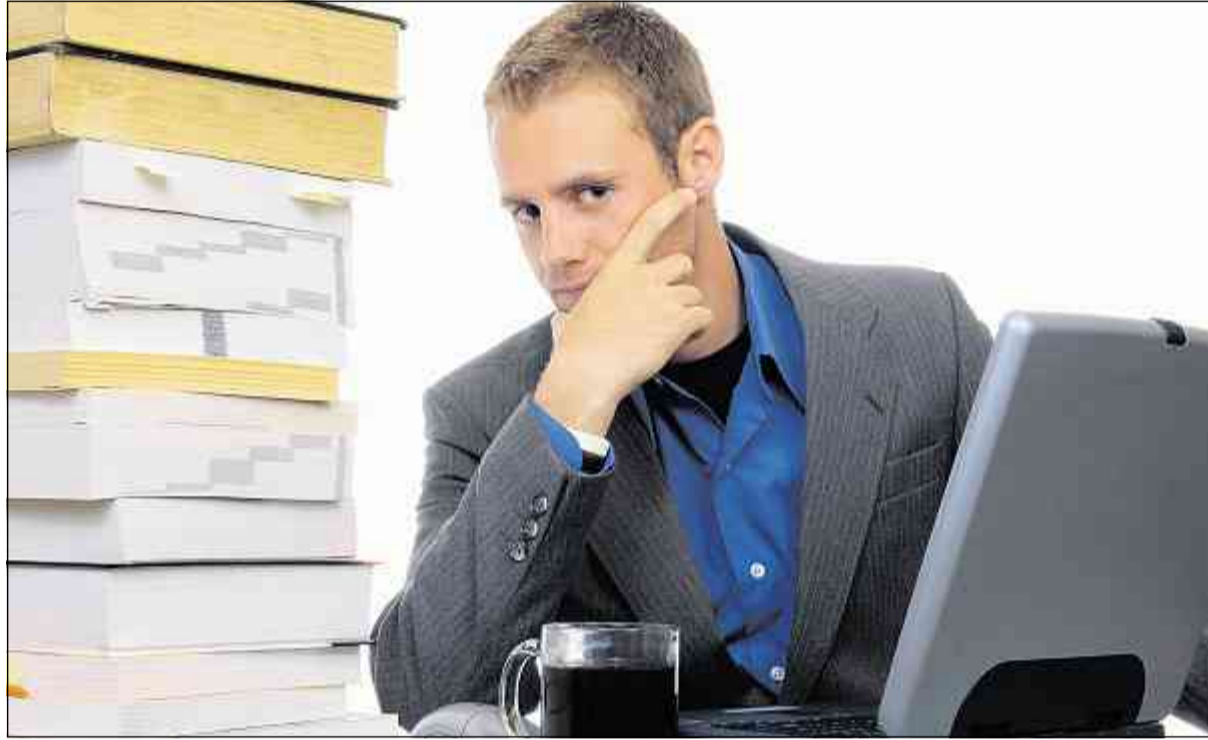
Prendre quelques minutes pour lister les tâches à effectuer permet de gagner du temps par la suite.

Prévoir les imprévus: il serait illusoire de penser que, malgré tous nos efforts, la journée de travail va se dérouler précisément comme nous l'avons prévu. C'est pourquoi il faut savoir se dégager une certaine marge dans la journée, une heure de battement qui permettra de caser ici et là les aléas du quotidien.