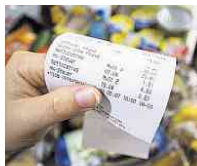
L'initiative de GastroSuisse demande que l'hôtellerie-restauration et les denrées alimentaires soient régies par un seul et même taux.

La pression politique des cafetiers-restaurateurs s'est manifestée de manière concrète lors de la session parlementaire d'hiver. Le Conseil national s'est aligné sur la position de GastroSuisse en renvoyant au Conseil fédéral le projet de taux unique de TVA et en lui demandant de présenter une réforme comprenant deux taux (au lieu de trois aujourd'hui). La restauration et l'hôtellerie bénéficieraient d'un taux réduit, au même titre que les denrées alimentaires. « Bien que la décision du Conseil national aille dans notre sens, nous déposerons tout de